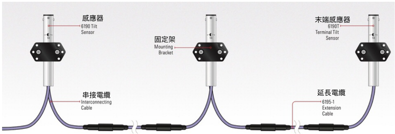
可多個感應器串連使用的6190 建物傾斜儀